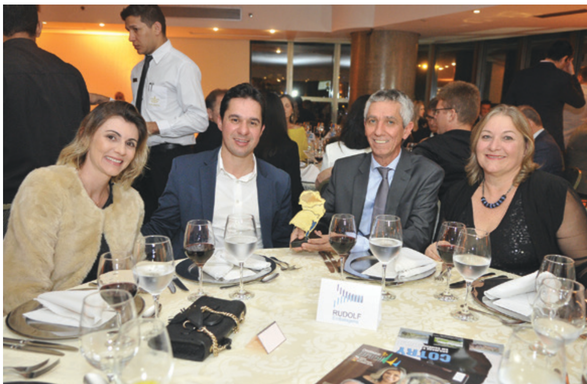
Convidados - Rudolf Embalagens