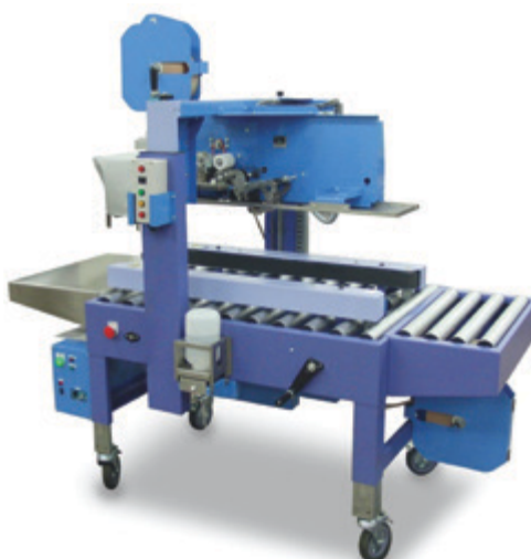
Dispensador Automático de Fita Gomada RT-6000