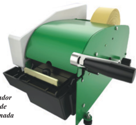
Dispensador Manual de Fita Gomada RT-800